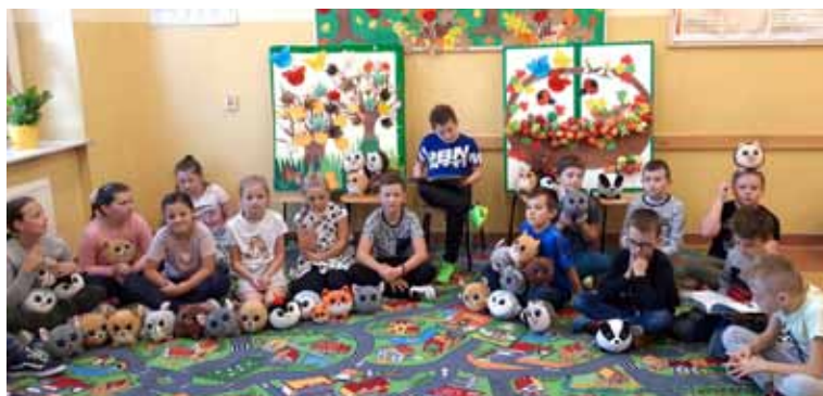
Szkolne Przygody Gangu Słodziaków – Dzień Głośnego Czytania