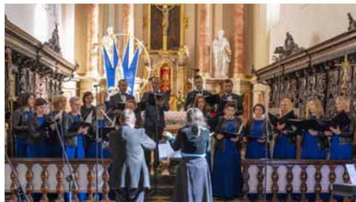
„W dążeniu do wolności – przekroczyć próg nadziei”

Ostatnim działaniem projektowym wieńczącym projekt „Książka (...) przyjaciel bez interesu, domownik bez naprzykrzenia” – słowa I. Krasickiego w świetle działań MBP w Dynowie dofinansowanego z Ministerstwa Kultury i Dziedzictwa Narodowego, była realizacja działania interdyscyplinarnego pod hasłem: „ Najpiękniejsza jest polska jesień... ”. Myśl przewodnią tego wydarzenia stanowiła jesień, ukazana przez pryzmat twórczości artystycznej, muzycznej i w opisie teoretycznym.