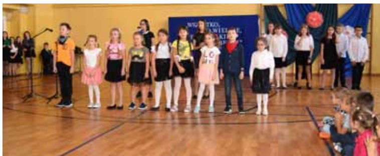
Dzień Komisji Edukacji Narodowej