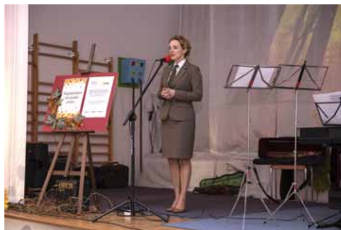
Najpiękniejsza jest polska jesień...

Partnerem w realizacji tego działania był Środowiskowy Dom Samopomocy w Dynowie . Uczestnicy ŚDS wzięli udział w warsztatach artystycznych tworzenia jesiennych kompozycji z suchych liści i kwiatów. Powstały piękne prace, które zostały zaprezentowane 15 listopada 2019 r. podczas spotkania w Środowiskowym Domu Samopomocy. W tym dniu, na scenie ŚDS w Dynowie, w pełnej krasie, okazałości i z wszystkimi swymi odcieniami zaprezentowała się jesień. Kolory żółty, brązowy, czerwonawy i brązowy dominowały na wystawie prac wykonanych podczas warsztatów florystycznych i zdjęć o tematyce jesiennych przygotowanej przez Nadleśnictwo Dynów.