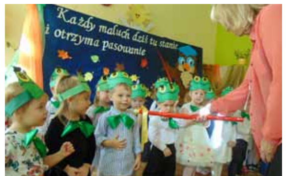
Pasowanie na przedszkolaka