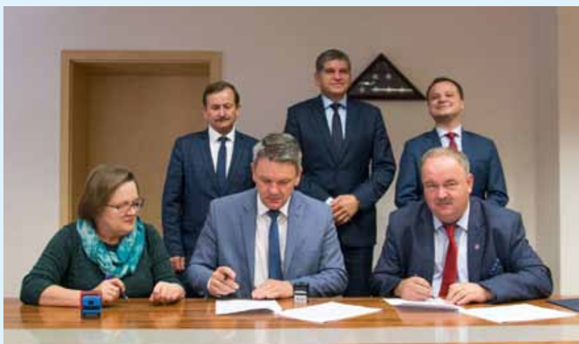
Podpisanie umowy o dofinansowanie projektu w Urzędzie Marszałkowskim Województwa Podkarpackiego w Rzeszowie