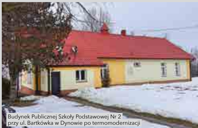
Budynek Publicznej Szkoły Podstawowej Nr 2 przy ul. Bartkówka w Dynowie po termomodernizacji