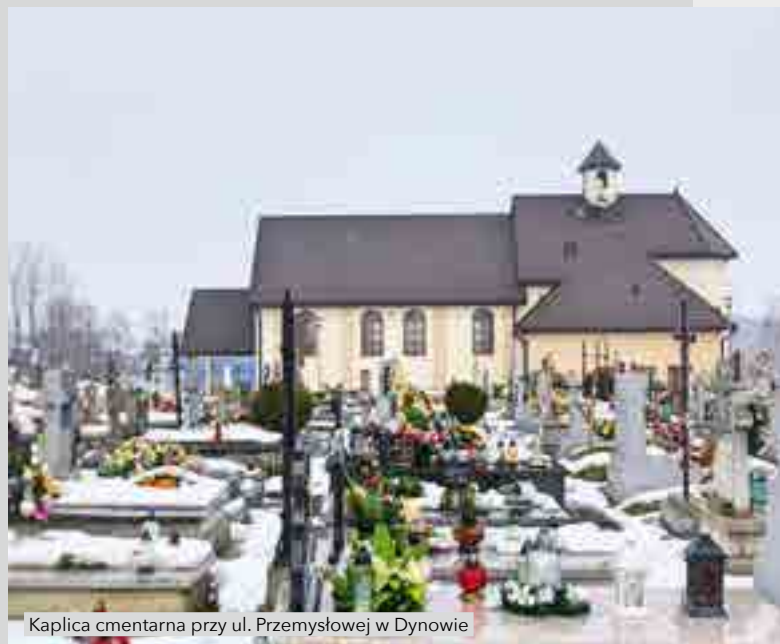
Kaplica cmentarna przy ul. Przemysłowej w Dynowie

W 2017 r. oddano do użytku kaplicę cmentarną, realizowaną w latach 2014–2017. Koszt brutto inwestycji 1 493 637,76 zł (netto 1 257 079,30 zł). Całość kosztów inwestycji pochodziła z budżetu Miasta. Obszerne informacje związane z jej realizacją i oddaniem do użytku zamieszczono w DKS nr 4 z 2017 r. Wysokość kosztów poniesionych w 2017 r. – 602 035,87 zł .