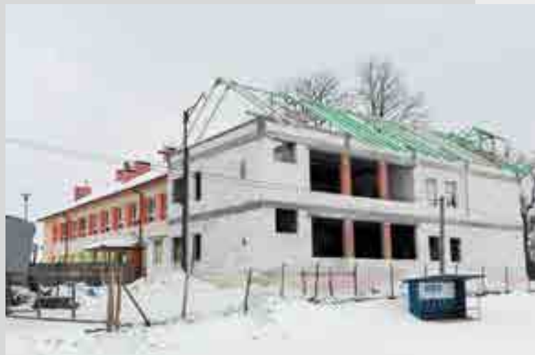
Rozbudowa Przedszkola Miejskiego w Dynowie

W 2017 r. wydatkowano 179 236,19 zł ze środków własnych.