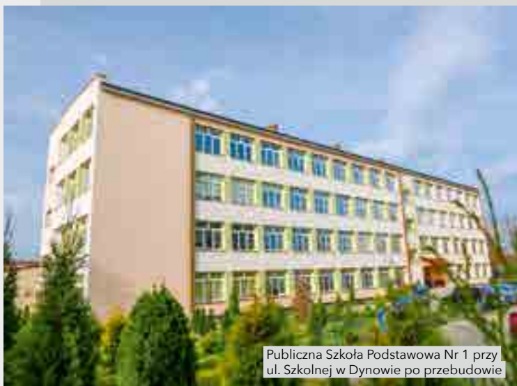
Publiczna Szkoła Podstawowa Nr 1 przy ul. Szkolnej w Dynowie po przebudowie

Realizacja projektu umożliwia prowadzenie zajęć lekcyjnych w klasoracowniach do matematyki, przyrody, informatyki, fizyki