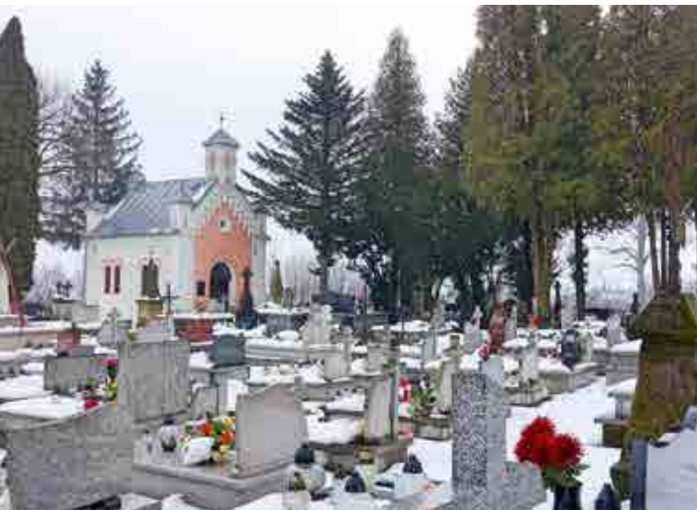
Fragment zabytkowego cmentarza przy ul. Grunwaldzkiej w Dynowie