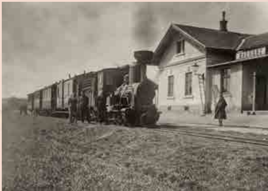
Budynek stacji kolei wąskotorowej w Bachórz.