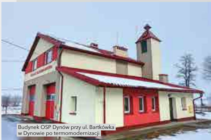
Budynek OSP Dynów przy ul. Bartkowska w Dynowie po termomodernizacji

W 2017 r. wydatkowano – 1 334 703,74 zł, w tym dofinansowanie UE – 1 071 885,72 zł.