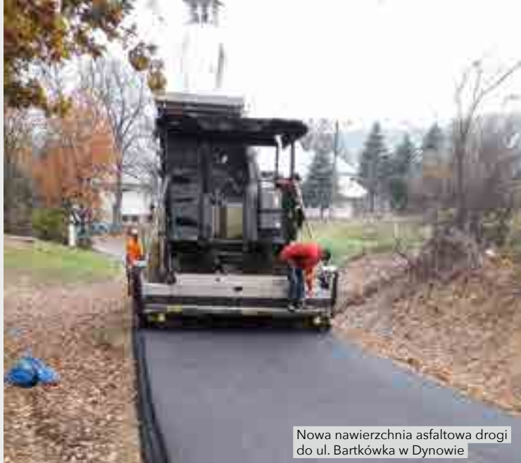
Nowa nawierzchnia asfaltowa drogi do ul. Bartkówka w Dynowie

Remont drogi dz. nr ewid. 2113/2 w Dynowie, bocznej do ul. Sikorskiego w Dynowie o długości 160 m.b. – Wykonano nową nawierzchnię asfaltową na długości 90 m.b. jezdni, nową nawierzchnię betonową z prefabrykowanych płyt ażurowych na długości 70 m.b. Koszt 111 878,59 zł , dofinansowanie 89 000,00 zł , środki własne Miasta 22 878,59 zł .