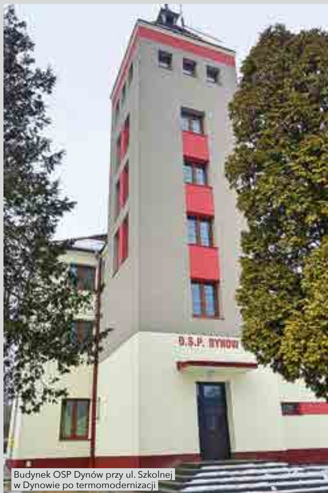
Budynek OSP Dynów przy ul. Szkolnej w Dynowie po termomodernizacji