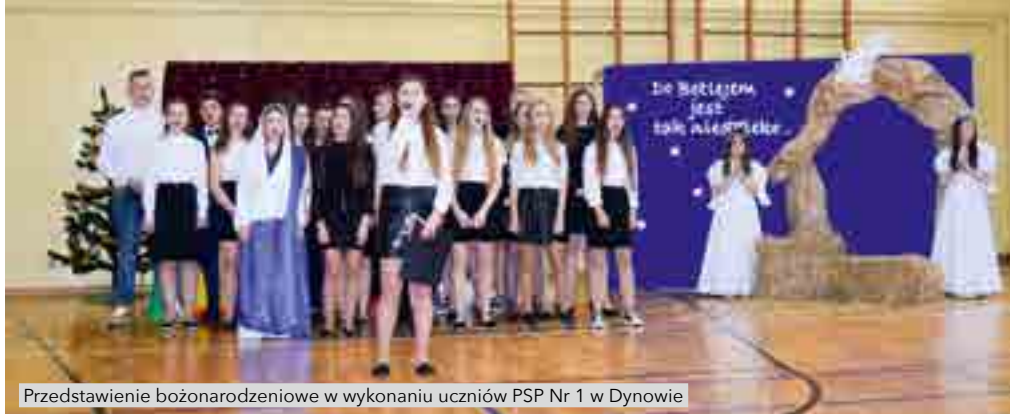
Przedstawienie bożonarodzeniowe w wykonaniu uczniów PSP Nr 1 w Dynowie

Anna Nowicka-Hardulak Kierownik Urzędu Stanu Cywilnego w Dynowie